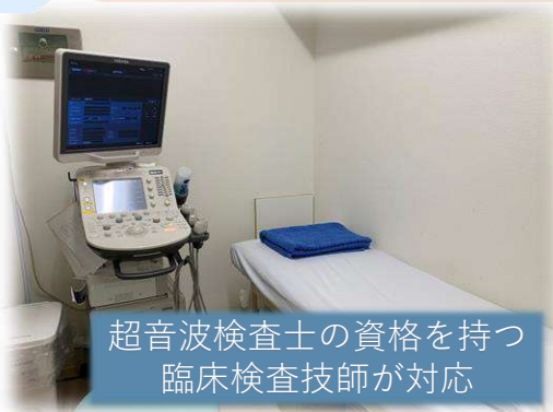
超音波検査士の資格を持つ 臨床検査技師が対応

大腸内視鏡検査（内視鏡画像解析AIを使用）や超音波検査、CTなどの機器を揃えているため、多くの精密検査を速やかに行うことができます。また、基幹病院との連携もスムーズです。