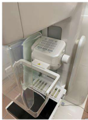
マンモグラフィー検査